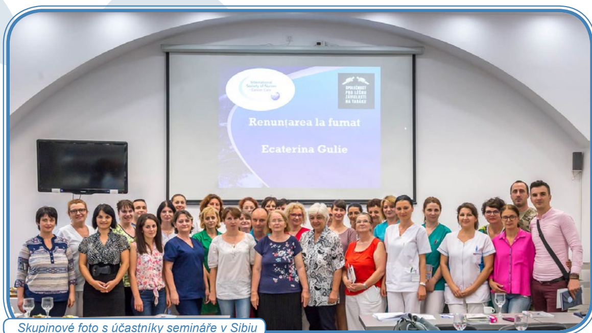
Skupinové foto s účastníky semináře v Sibiu

21. června 2018 se v Sibiu konal seminář o Vzdělávání vedoucích pracovníků v ošetrovatelství na téma kontroly tabáku. Seminář byl uspořádán ve Vojenské nemocnici. Semináře se účastnilo 40 zdravotních sester (z nichž čtyři byly kuřačky) a tři doktoři; jedním z nich byl ředitel nemocnice. Slíbil, že na webových stránkách nemocnice zveřejní několik řádků textu s obrázkem. S Vojenskou nemocnicí v Sibiu jsme podepsali dohodu o spolupráci. Seminář u sester vzbudil velký zájem a doufaly, že se v rámci dalších vzdělávacích akcí v Sibiu znovu setkáme.