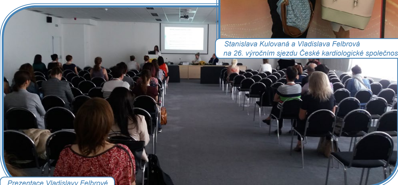
Prezentace Vladislavy Felbrové