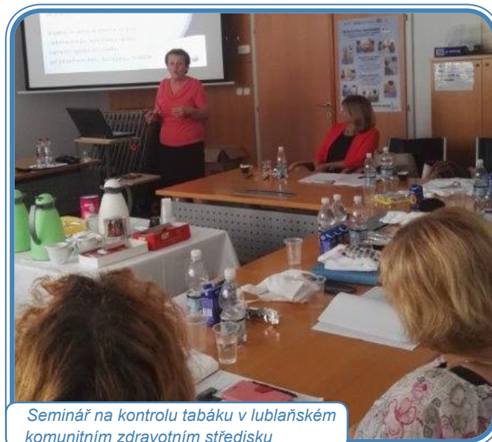
Seminář na kontrolu tabáku v lublaňském komunitním zdravotním středisku

Slovinský národní institut veřejného zdraví (NIPH) na oznámil, že 24% dospělých ve Slovinsku kouří. Celkem 63% obyvatel uvedlo, že poprvé kouřili před dosažením věku 18 let; 99% kuřáků uvedlo, že poprvé kouřili ve věku 25 a níže. Dále 40% patnáctiletých uvedlo, že kouření zkusili a 9% z nich kouří denně (NIPH, 2018).