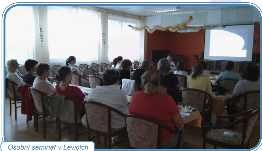
Osobní seminář v Levicích

Projekt Sestry východní Evropy – Centrum excelence pro kontrolu tabáku II byl umožněn díky grantu nadace Bristol-Myers Squibb na pokračování edukačních aktivit pro sestry ve střední a východní Evropě v kontrole tabáku