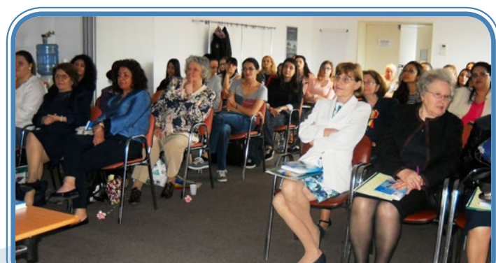
Účastníci národní konference v Bukurešti z 12. května 2018

V Bukurešti, v Hotelu Ibis, se 12. května 2018 konala Národní konference na téma „ZDRAVOTNÍ SESTRY JAKO VEDOUČÍ HLAS – ZDRAVÍ JE LIDSKÉ PRÁVO“ na připomenutí národního Dne zdravotních sester. Konference měla na 60 účastníků, mezi nimiž byly zdravotní sestry, pedagogové a studenti z různých částí země. Během konference byly prezentovány práce na šíření výsledků EE-COE II projektu s názvem „Vzdělávání vedoucích pracovníků v ošetrovatelství pro léčbu závislosti na tabáku“, jakož i jednotlivé kroky projektu, nabízené aktivity (např. semináře, veřejné události, informace o elektronickém vzdělávání, šíření informací a výsledků), přičemž následovala prezentace výsledků Mini grantů za rok 2017.