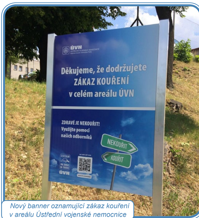
Nový banner oznamující zákaz kouření v areálu Ústřední vojenské nemocnice