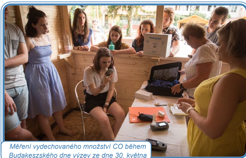
Měření vydechaného množství CO během Budakeszského dne výzev ze dne 30. května

Programů, ve kterých odborníci z Korányiova národního institutu pulmonologie nabízeli funkční vyšetření plic, měření vydechaného množství CO, vyšetření zdravotního stavu kardiovaskulární soustavy a zdravotní poradenství, se zúčastnilo na 662 lidí. Účastníci měli možnost se přihlásit do programu screeningu rakoviny plic nízkodávkovým CT, který je momentálně ve fázi klinického výzkumu na Korányiově institutu a má být implementován v celé zemi do roku 2021.