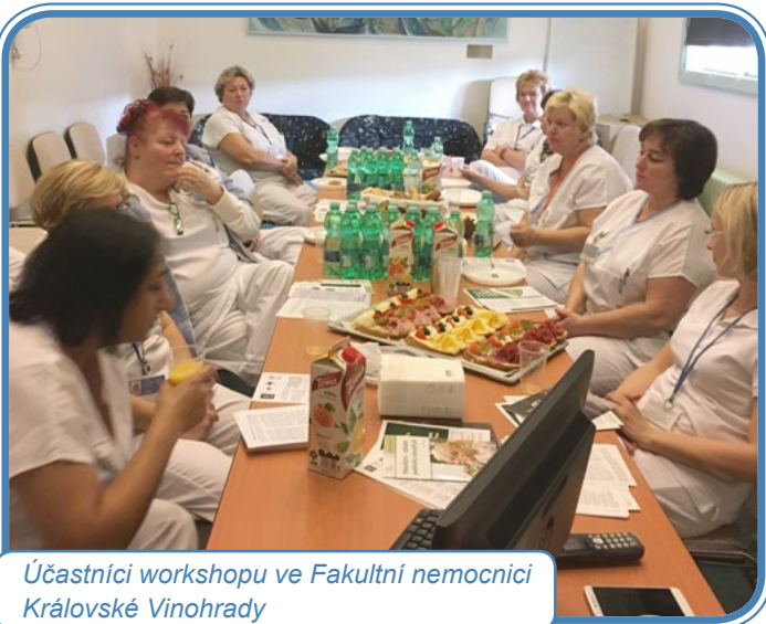
Účastníci workshopu ve Fakultní nemocnici Královské Vinohrady