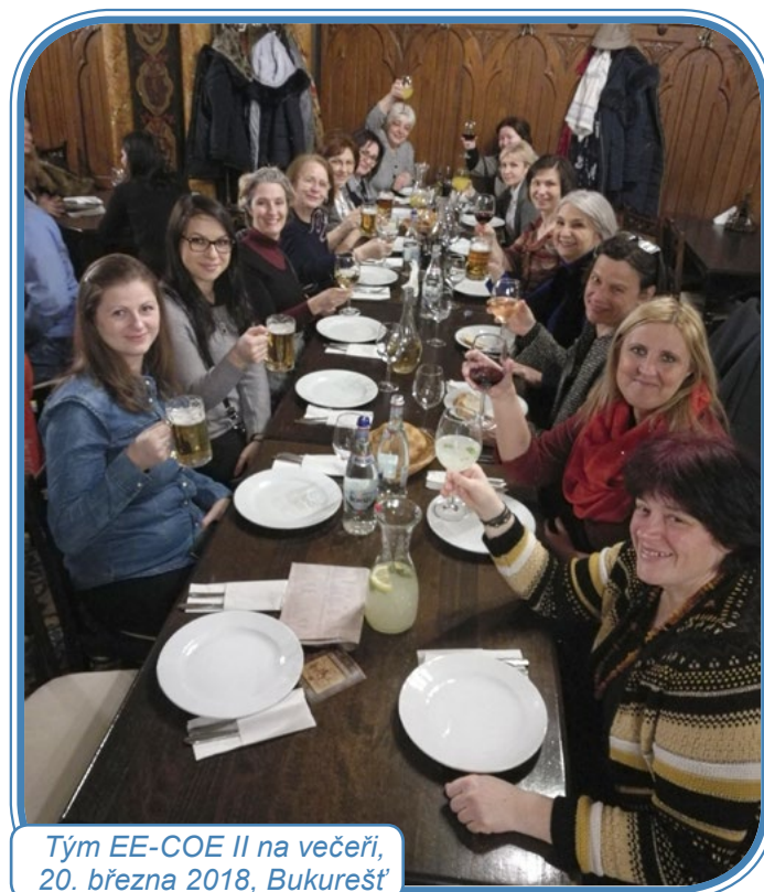
Tým EE-COE II na večeři, 20. března 2018, Bukurešť

Doktorka Bialous jednání zahájila přehledem o tabákové epidemii a roli zdravotních sester při řešení tohoto problému za pomoci inovativních modelů spolupráce. Po sdělení aktuálních informací o průběhu projektu a vynaládání rozpočtu každá země prezentovala doposud uskutečněné aktivity, získané poznatky a výzvy, kterým čelila. Profesorka Sarna potom představila vzdělávání pomocí e-learningu a popsala předběžné výsledky studia.