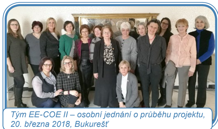
Tým EE-COE II – osobní jednání o průběhu projektu, 20. března 2018, Bukurešť

Jednání bylo vysoce produktivní a velmi pomohlo všem partnerům projektu díky osobním rozhovorům o aktivitách v rámci projektu, které je jinak obtížné vzhledem k mezinárodní spolupráci vést.