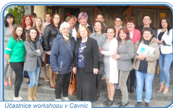
Účastnice workshopu v Cavnic

Dne 24. dubna 2018 byl pořádán ve městě Cavnic v okrese Maramureș workshop na téma „ školení vedoucích sester v léčbě tabákové závislosti “. Workshopu v Cavnic se zúčastnilo 22 sester. Tento workshop byl interaktivní a účastnice byly nadšené a pozvaly nás do Cavnic znovu s dalšími vzdělávacími kurzy.