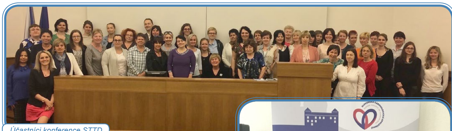
Účastníci konference STTD

Každoroční konference STTD všech léčebných středisek se konala 18. dubna 2018 v Praze. Byly zde shrnuty aktivity projektu EE-COE II.