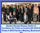
Eastern Europe Nurses Centre of Excellence for Tobacco Control (EE-COE II) Phase II 2018 Partners Meeting, Bucharest, RO

Our aim was to assess the impact of an online evidence-based educational program on improving nurses' self-reported interventions with smokers according to the 5As (i.e., ask, advise, assess, assist and arrange) and attitudes and beliefs about tobacco control before and 3-months after participation in the online program. We also will compare these results with data from the Phase I study.