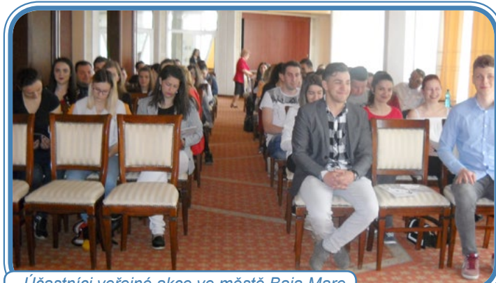
Účastníci veřejné akce ve městě Baia Mare