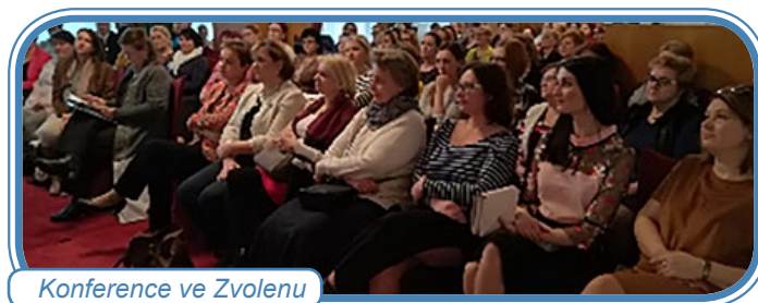
Konference ve Zvolenu